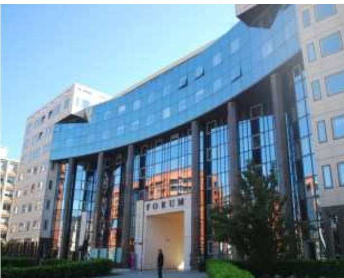
Le bâtiment Forum