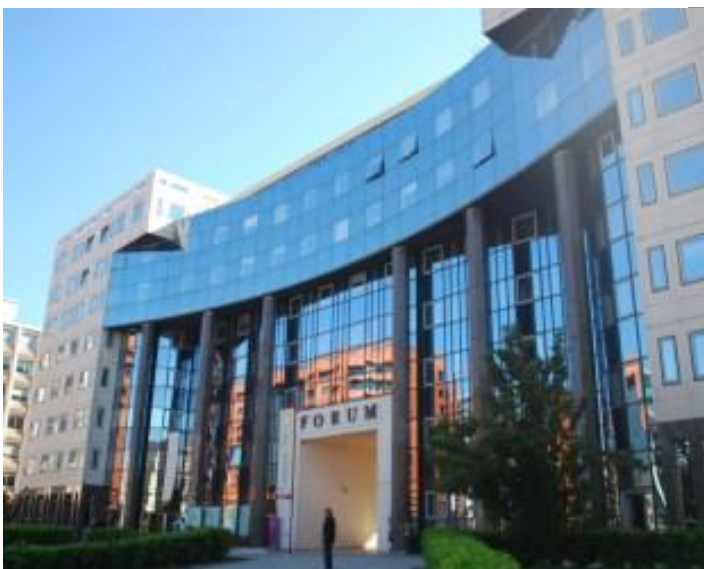
Le bâtiment Forum